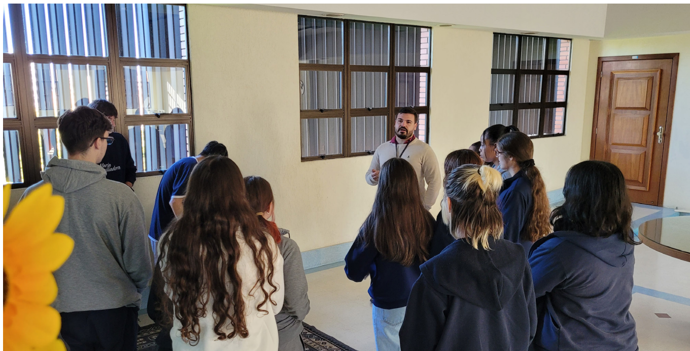
Divulgação Colégio Maria Auxiliadora