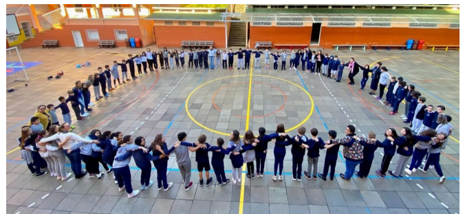
Alunos realizando o abraço da paz no pátio da escola