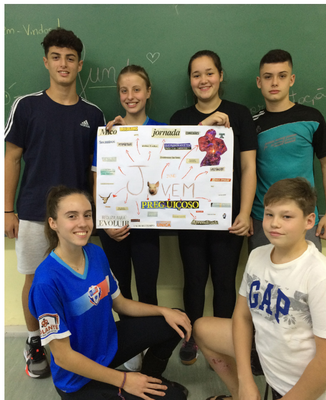
JUND exerce papel fundamental na disseminação da Cultura de Paz na escola

O grupo do JUND tem um papel essencial para disseminar uma cultura da paz na Escola, pois oportuniza momentos em que os alunos falam sobre medos e insegu-