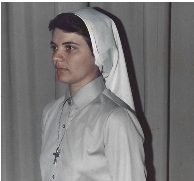
Aos 23 anos fazia seus primeiros votos como Irmã de Notre Dame

Atualmente, ela está prestes a embarcar em um novo desafio. “Ao deixar a função de superiora provincial, solicitei fazer uma experiência internacional. Por isso, estou me preparando para participar do programa de Língua Inglesa que a Congregação oferece para os países que não têm o Inglês como língua oficial”, revela a Irmã, que neste semestre embarcará rumo à cidade de Chardon, no Estado de Ohio, nos Estados Unidos. “Tenho certeza de que novas experiências, novos desafios e novas aventuras me aguardam.” ♦