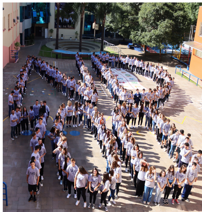
Assessoria de Imprensa do Colégio Notre Dame Passo Fundo

“Para mim, que faço parte dessa história há 24 anos, como Irmã de Nossa Senhora, foi uma experiência gratificante. Desde o início, quando buscamos a participa-