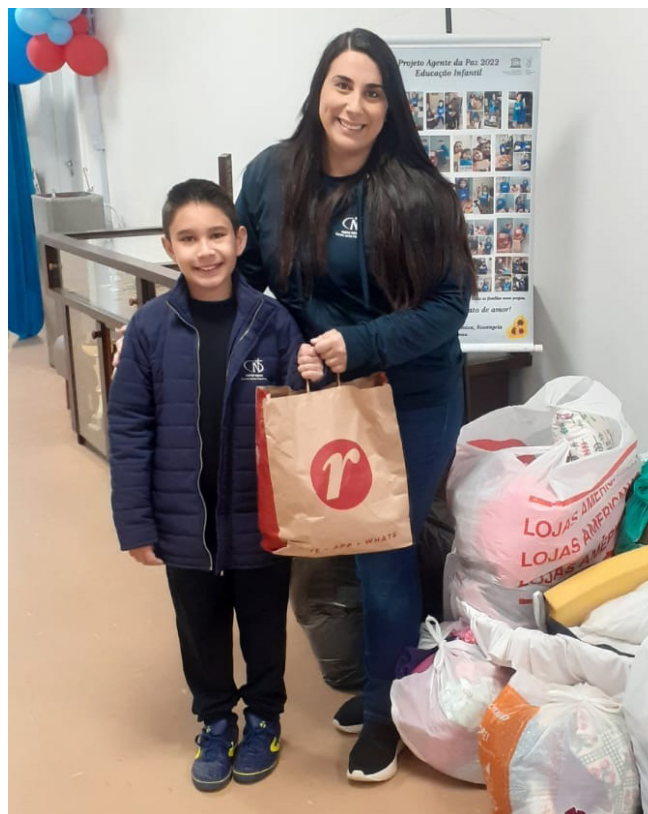
Escola realiza campanha solidária para arrecadação de agasalhos, cobertores e alimentos para famílias carentes

Esses valores apontam o caminho para a nossa sociedade superar toda forma de violência que teima em crescer em nosso meio, visto que a natureza humana tende a ser egoísta e autodestrutiva, quando não devidamente trabalhada e fundada em bons princípios e na abertura ao Transcendente.