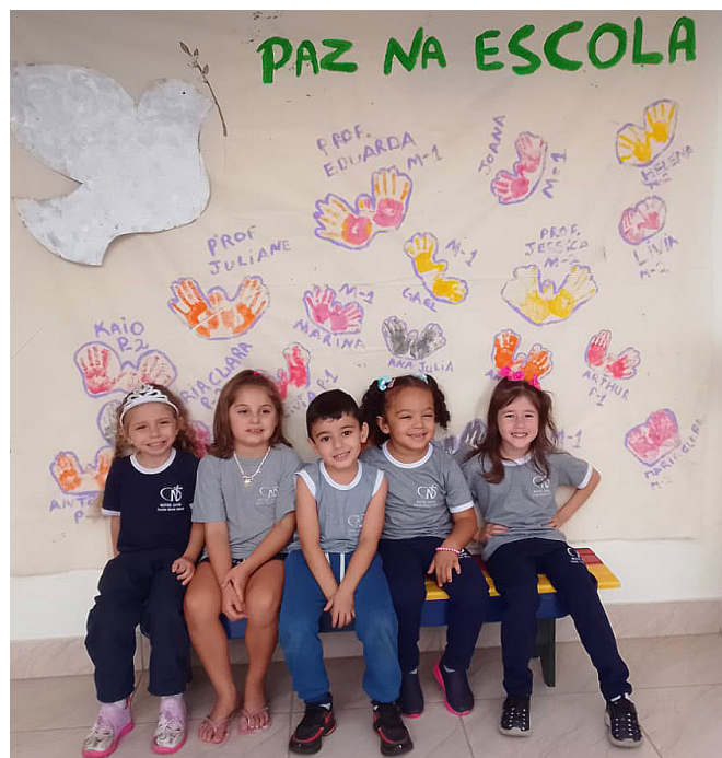
Na Escola Notre Dame, os alunos fizeram um cartaz coletivo, onde pintaram as mãos simbolizando pequenas pombas

Com amor e respeito, é possível gerar uma socie-