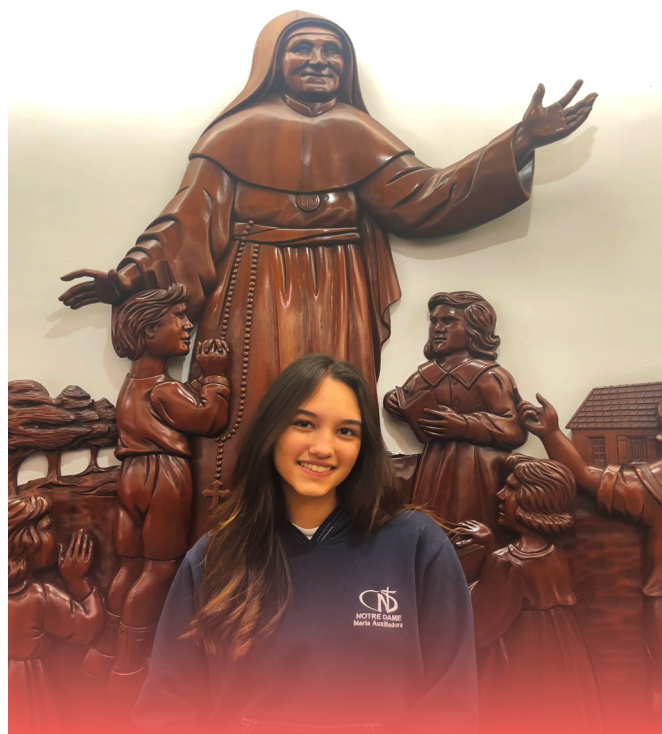
Divulgação Colégio Maria Auxiliadora

muito animada para o encontro, quero muito conhecer pessoas novas, ter a experiência de algo que nunca fiz antes e, principalmente, saber da história da nossa instituição.” ♦