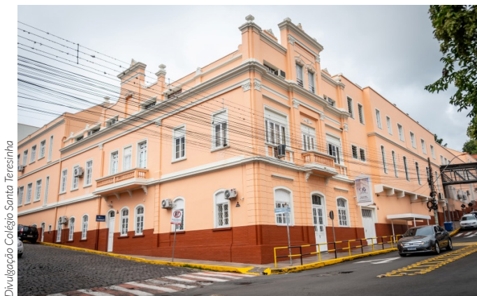
Divulgação Colégio Santa Teresinha

que atuar na área requer muita vocação e preparo emocional. No entanto, a docente afirma que, apesar dos desafios, lecionar foi uma das melhores escolhas da sua vida. “Sou realizada no que faço. É muito gratificante rever ex-alunos e ver e/ou ouvir o quanto se pode fazer a diferença na vida deles, e essa é a maior recompensa que se pode ter”, finaliza. ♦